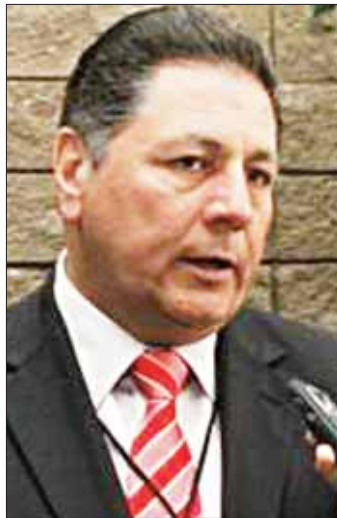
Samuel Moreno denunció que hay cerca de 2 mil 500 irregularidades señaladas por el ISAF en la cuenta pública del gobierno del estado

El gobernador señaló que dentro de la Cuenta Pública que presentaron no existe problema alguno, y que de las más de dos mil observaciones que realizó el ISAF, ya solo quedan por comprobar 600. Nomás 600. Veremos que sigue en esta