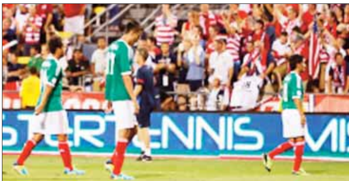
Se podría perder una derrama de mil millones de dolares si la selección no califica al mundial de Brasil

Elacabose.com.mx es editado para su distribución nacional en la calle Luis Donaldo Colosio 107 Colonia Centro en Hermosillo, Sonora LA LINEA EDITORIAL DE ESTE MEDIO, NO NECESARIAMENTE COINCIDE CON LA OPINION DE LOS COLUMNISTAS QUE AQUI ESCRIBEN, MISMO QUE SON AJENOS A CUALQUIER POLITICA O ACUERDO COMERCIAL DEL MEDIO CON PARTICULARES.