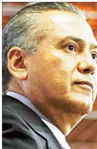
Manlio Fabio Beltrones factor importante para la aprobación de las reformas del Presidente Peña Nieto

Crédito Público del Gobierno Federal, Luis Videgaray, tuvo su momento de gloria al entregar previamente al Congreso de la Unión la documentación de la iniciativa de la reforma en cuestión. Con este acto, Videgaray Caso se repone un poco después de los malos pronósticos de crecimiento que dijo iba a registrar nuestro país.