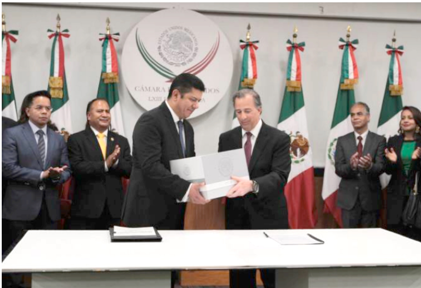
ENTREGO EL SECRETARIO DE HACIENDA JOSE ANTONIO MEADE (PANISTA) EL PRESUPUESTO DE INGRESOS Y EGRESOS PARA EL EJERCICIO 2017. Con un recorte de 239 mil 700 millones de pesos en relación al presupuesto anterior del 2016, la entrega la hizo al congreso federal para su aprobación total de 4.8 billones de pesos.

ABEL MURRIETA DIPUTADO FEDERAL POR EL PRI. Declaro ante la prensa nacional y estatal, que la investig-