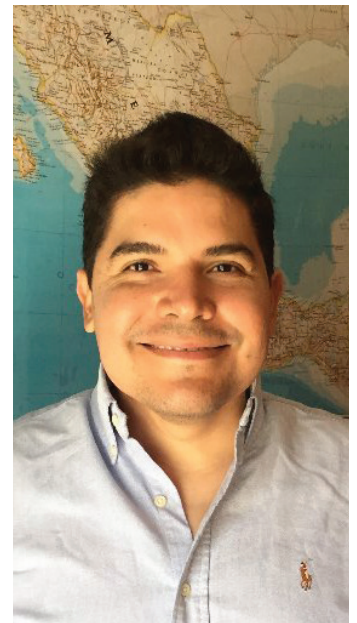
carrera hace más de 10 años, ya que solo se ha dedicado a vivir de la ubre.