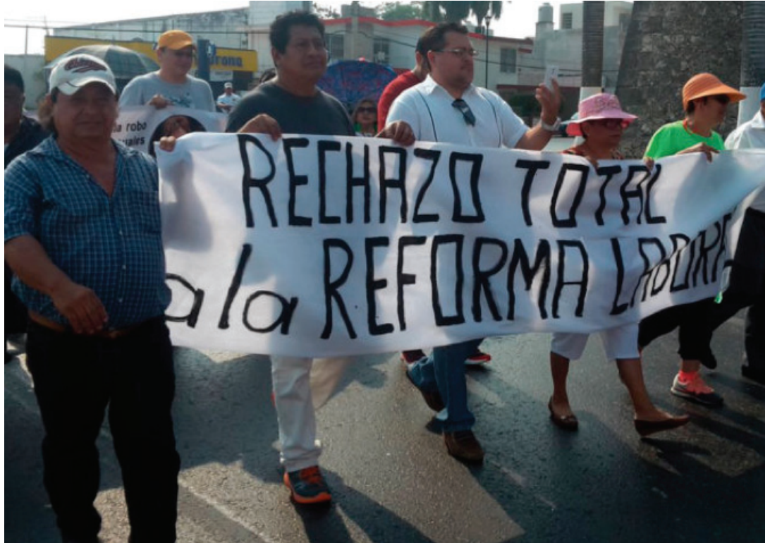
Los cuestionamientos ya están en todo lo alto, pues los analistas laborales señalan que la reforma laboral sólo se ha platicado con algunos segmentos del sector obrero y con los empresarios, poniendo como oferta quitar el Out Sourcing que sólo ha beneficiado a los patrones, por lo que señalan negociaciones en lo oscuro ¡será!