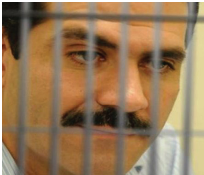
QUE BUEN SHOW PUBLICITARIO SE TRAEN LOS JUECES FEDERALES CON EL CASO DE GUILLERMO PADRÉS ELÍAS; ex gobernador de Sonora que trajo el agua desde la presa el novillo (varios kilómetros) al pueblo sediento de Hermosillo y se acabaron los tandeos, con la obra millonaria del ACUEDUCTO

Pero eso no le interesa al pueblo de la CACAREADA transparencia de los gastos, porque hay cosas más importantes que hacer como combatir la pobreza ya que aquí en Sonora el 29% de la población vive en pobreza y el 2.5% en pobreza extrema, que haya cupo en las preparato-