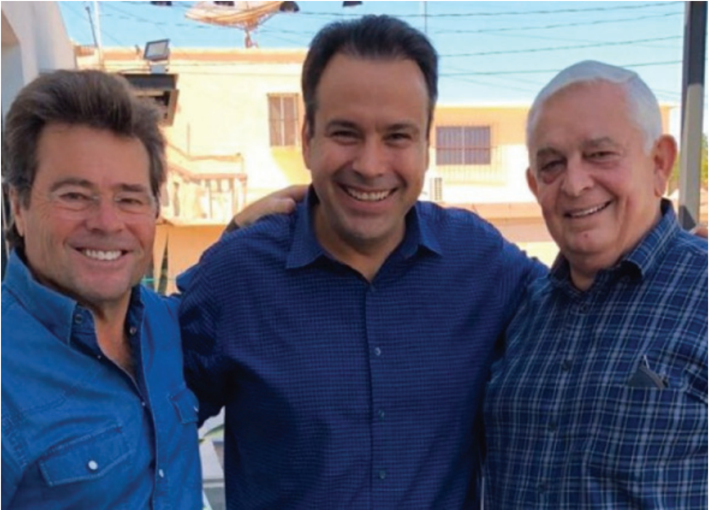
La rebelión en Cajeme busca debilitar a Sylvana Beltrones. Y Toño Astiazarán tendría la encomienda de destruir al Maloro Acosta, a petición expresa de Damián Zepeda, el virtual candidato del PAN a gobernador de Sonora en 2021.

ba su apoyo y propuestas a la primera candidata a gobernadora por el PRI, se desarrolló la breve plática con Sylvana: