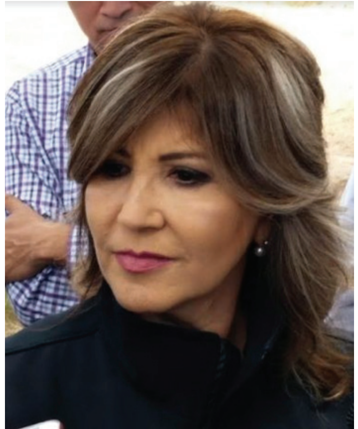
La alcaldesa de Hermosillo pone en jaque el futuro de una de las más grandes tradiciones de Hermosillo, al negar donar terreno que utilizan miembros la tribu Yaqui en sus tradicionales fiestas de Semana Mayor, donde destaca la realización del viacrucis y la quema de máscaras