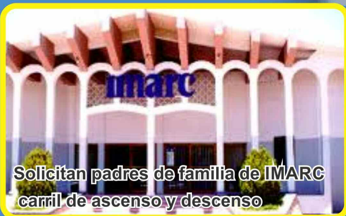
Solicitan padres de familia de IMARC carril de ascenso y descenso