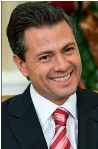
Los panistas de Sonora le bajaron dos rayitas a la campaña contra Peña Nieto.