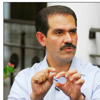
Controlan acceso a los informes de Guillermo Padrés para evitar sorpresitas.