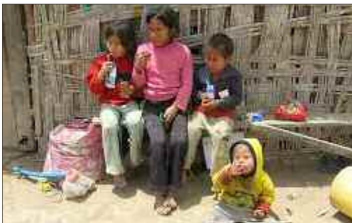
Un aumento al salario mínimo le ahorraría al gobierno miles de millones de pesos en inútiles programas sociales para combatir el hambre, la pobreza o atención médica que muchas veces resultan electoreros.

Después de que la madre naturaleza descargara su furia en tres ocasiones en menos