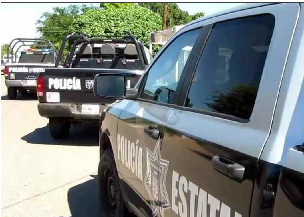
Los robos al alza y los ciudadanos de Hermosillo desamparados porque la policía ni sus luces por las colonias de Hermosillo.