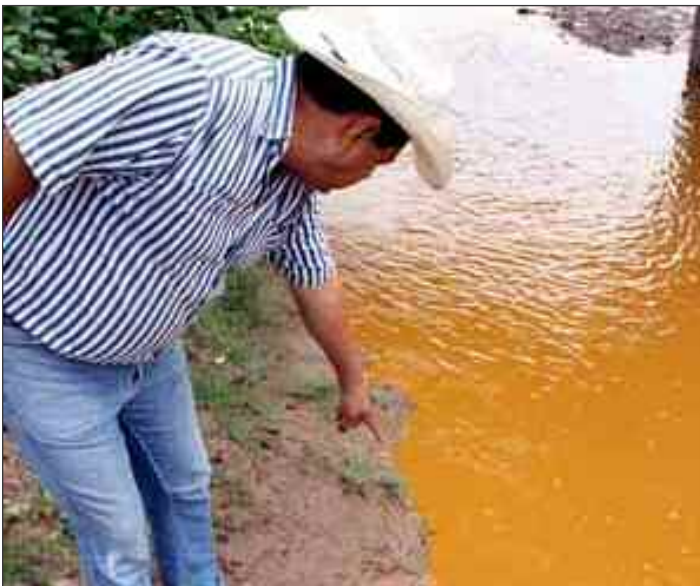
Cayó del cielo la tragedia ecológica en el río Sonora porque ya nadie se acuerda de la pugna por la operación del Acueducto Independencia entre Yaquis y el Gobierno Estatal.

Vale más que aquí la dejemos, hasta la próxima.