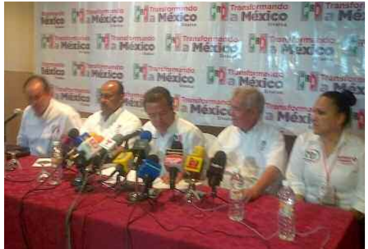
El presidente del CEN del PRI Cesar Camacho Quiroz llegó a Hermosillo con un discurso de hace 70 años lleno de puras mentiras y promesas incumplibles.