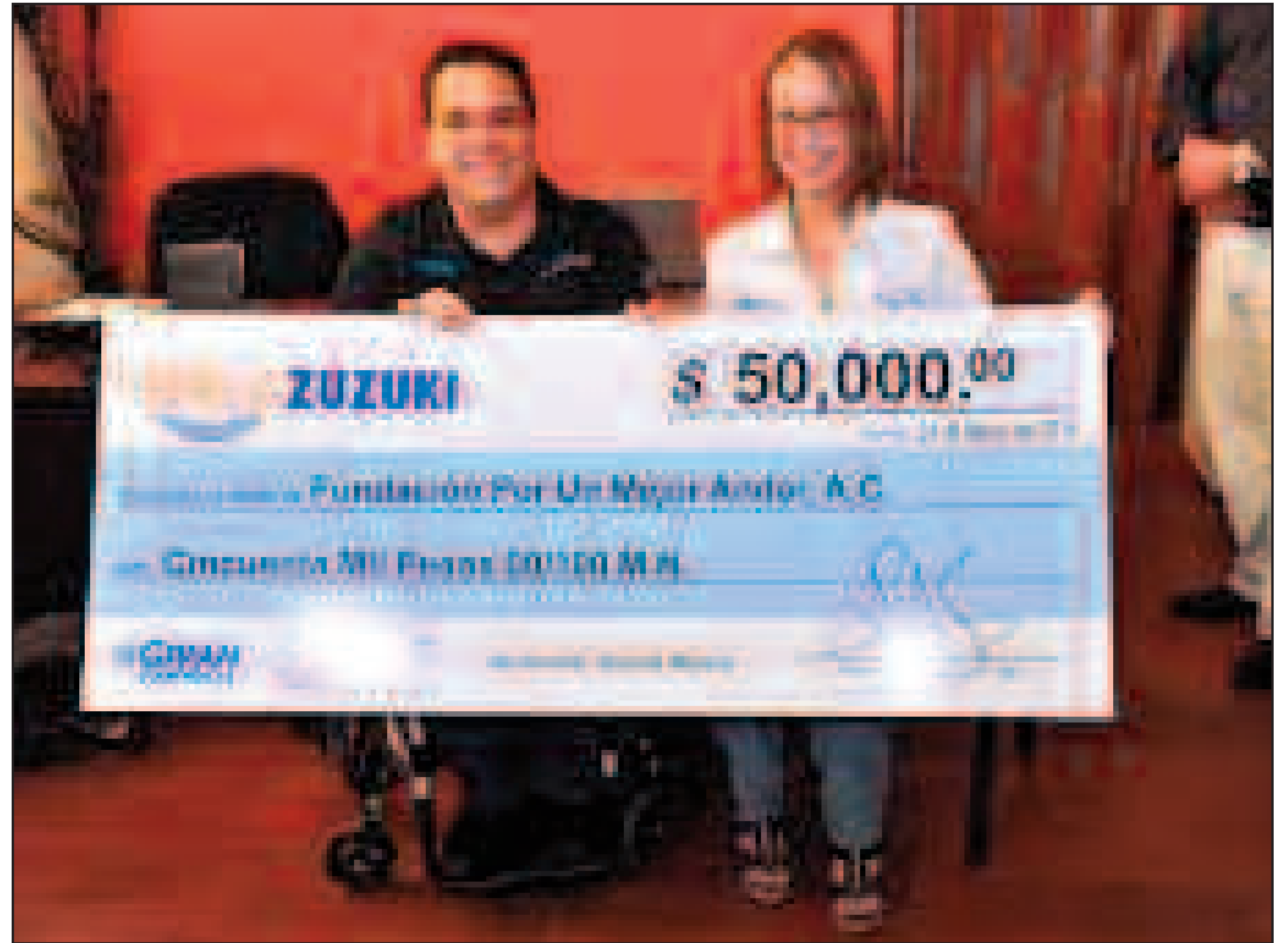
Un joven víctima de un accidente producto de una irresponsabilidad que lo obliga a convivir con una silla de ruedas fue utilizado para aprobar una ley contra el alcohol y no contra los accidentes.