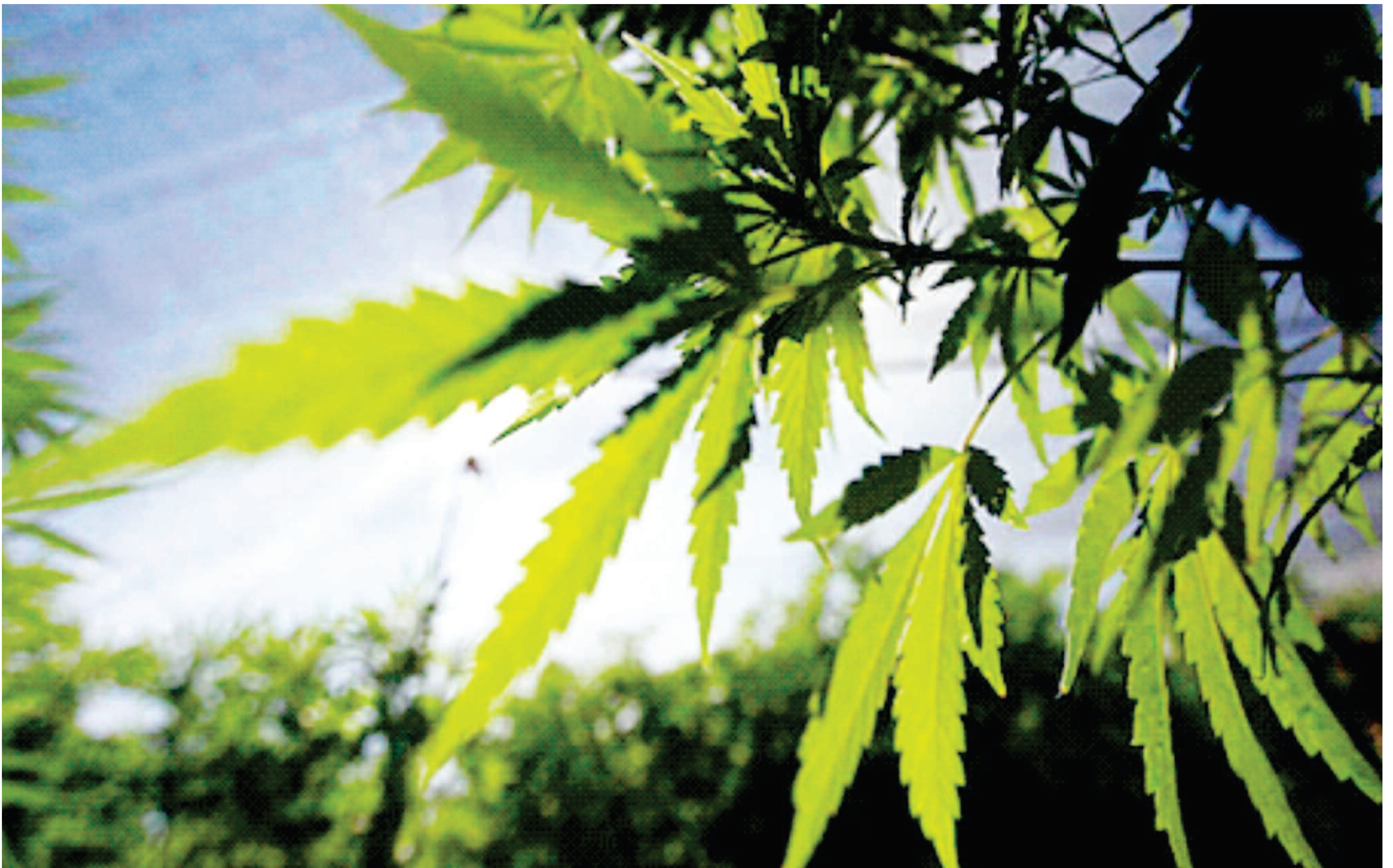
En 23 estados de México, la marihuana supera el consumo de tabaco y en 10 al de alcohol como droga de inicio.

Indicaron en un comunicado, que de ser negadas las solicitudes, la organización de jóvenes del partido, Juventudes de Izquierda (JIZ), interpondrá un amparo colectivo ante el poder judicial similar al que concedió la Suprema Corte a la asociación civil SMART