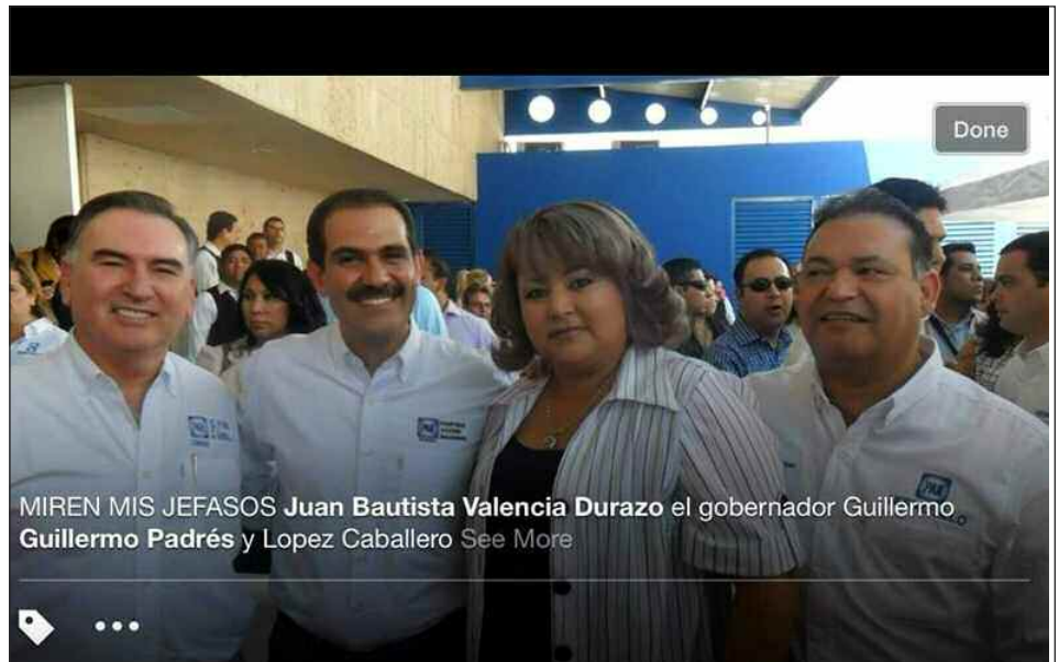
#LaddySalchicha enseña como matar gatos y perros por redes sociales, ese es el humanismo del PAN

Gusta' de otras personas en la Red (conocidos o no) para poder utilizarlos, por lo que resulta más fácil crear otras cuentas (gratuitas), que andar molestando a tus contactos.